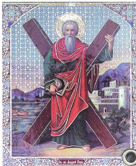
Святий апостол Андрій Первозваний 13 грудня (30 листопада)

силу Хреста Господнього. Апостола Андрія розіп'яли на хресті, який складався з двох перетятих навскіс перекладин у вигляді букви «Х». Відтоді цей хрест називають Андріївським. Під час жорстоких знущань апостол прославляв Господа і не припиняв проповіді. Після дводенних страждань святий Андрій возніс хвалу Богу і промовив: «Господи, Ісусе Христе, прийми дух мій». Тоді яскраве сяйво Божественного світла освітило хрест і розіп'ятого на ньому мученика. Коли сяйво зникло, душа апостола Андрія Первозваного відійшла до Господа. Мученицька кончина апостола Андрія стала органічним підсумком усього життя святого апостола, несіння ним хреста і наслідування Божественного Учителя. Зерна віри, посіяні святим апостолом Андрієм, щедро зійшли завдяки зусиллям благовірного князя Володимира. Київська Русь сподобилася Святого Хрещення — прийняла віру візантійську. Відтоді пам'ять апостола Андрія Первозваного особливо шанується в Українській Православній Церкві й серед нашого благочестивого народу.