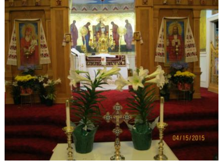
Квіти, якими був

Дуже дякуємо цим двом родинам за щедру пожертву.