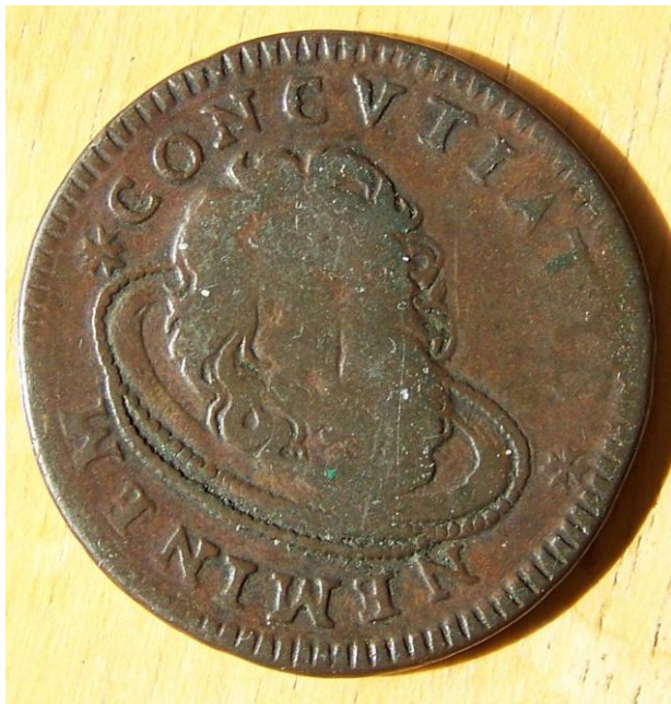
A 1742 Tari of the Knights Hospitaller , depicting the head of John the Baptist on a platter.

The day of the martyrdom of St. John the Baptist is commemorated by the Holy Orthodox Church on the 29 th of August (11 September NS) and is called the Beheading of John the Baptist . A strict fast is prescribed on this day in order to remind us of the strict life of St. John the Baptist for which he was blessed by God and to avoid the excesses of Herod which led to such a terrible sin. The Holy Church teaches that St. John the Forerunner is the greatest of all saints after the Mother of God.